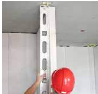
Paso 9 Revisión de alineación y posicionamiento