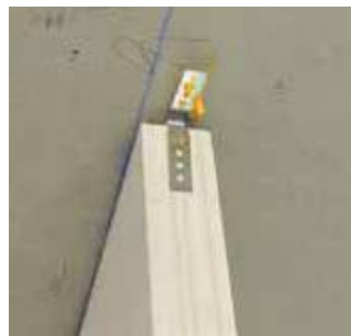
Paso 12 Instalación de soporte de fijación a techo