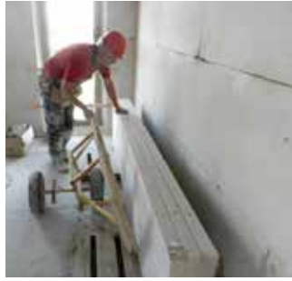
Paso 2 Levantamiento del panel