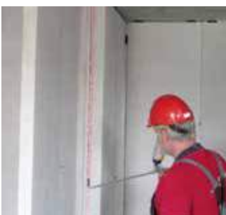
Paso 13 Rellenado de juntas con espuma