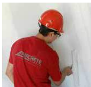
Paso 15 Rejuntado (1mm); el resto de la pared SUPER LISA esta lista para ser pintada/tapizada.