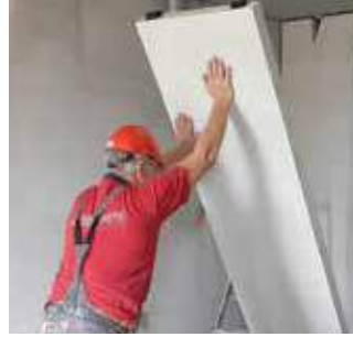
Paso 6 Levantamiento del panel