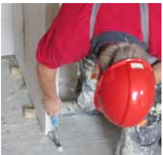
Paso 10 Instalación de cuñas de madera