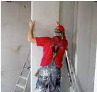
Paso 7 Posicionamiento del panel