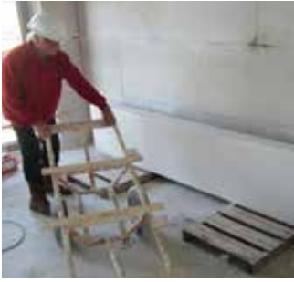
Paso 1 Utilización de carro transportador