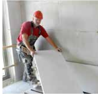
Paso 3 Transporte del panel