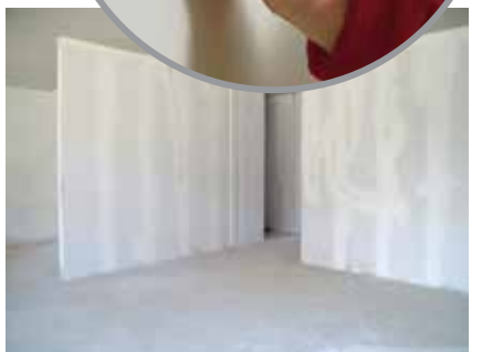
Resultado final de los paneles Aircrete