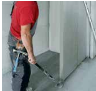
Paso 8 Fijación del panel con herramienta para posicionado