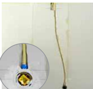
Paso 14 Ranurado de muro para instalación eléctrica