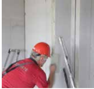
Paso 5 Aplicación de pegamento para conexión de paneles