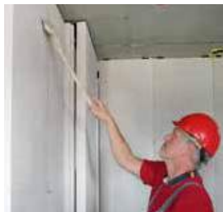
Paso 11 Remoción de pegamento excedente de juntas