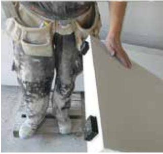
Paso 4 Gomas de instalación